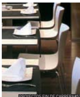
PROYECTOS FIN DE CARRERA#52