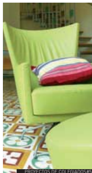
PROYECTOS DE COLEGIADOS#36