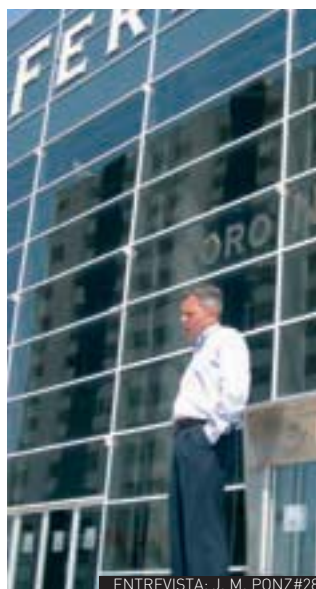
ENTREVISTA: J. M. PONZ#28